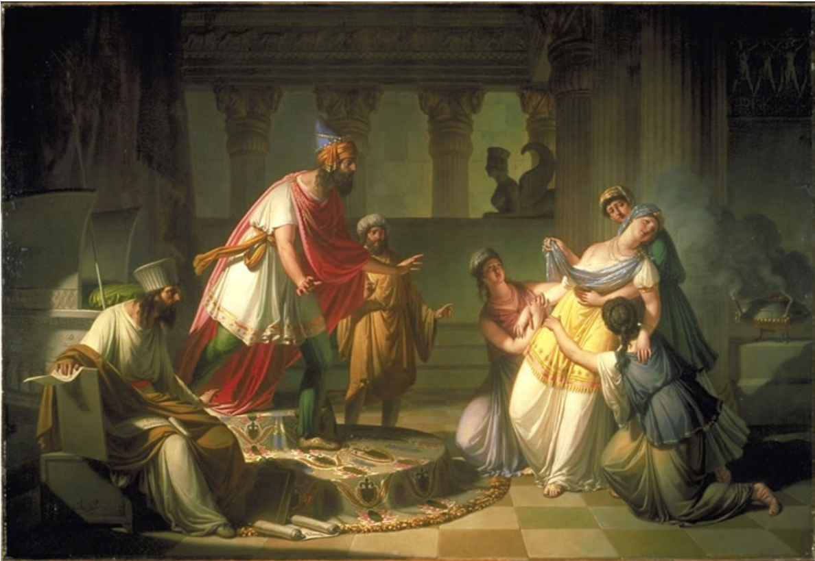
Francesco Caucig (Austro-Hungarian, 1755–1828) Queen Esther Before King Ahasuerus , ca. 1815 Oil on canvas, 55 3/4x 81 1/2 inches University of Virginia Art Museum http://www.virginia.edu/artmuseum/WE2002/art/pages/PIC05_jpg.htm